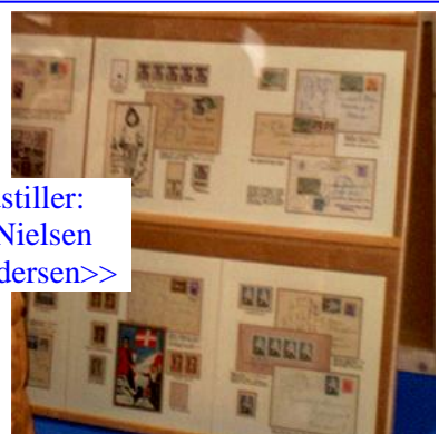
”Perler på snor” Fra en meget flot udstilling med mange sjældenheder!