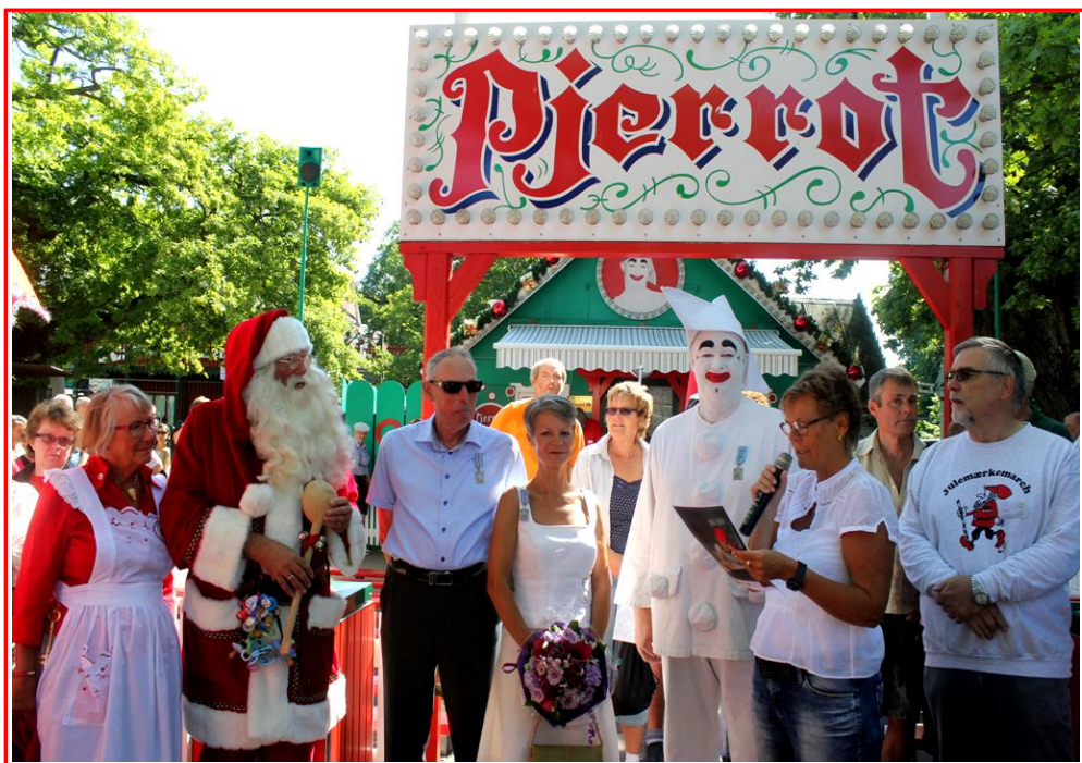
Foto fra åbningen af Julemærkemarchen på Bakken søndag d.21. Juli 2013.

Søndag d.21. juli 2013 blev der for andet år i træk afholdt en sommerudgave af Julemærkemarchen til fordel for Julemærkehjemmene, i forbindelse med den årlige Verdenskongres for Julemænd (d.21.-24. juli) på Bakken i Klampenborg. Der deltog 375 på de 3 distancer, (2, 5 & 10 km), Grev Ingolf og grevinde Sussie deltog sammen med Pjerrot og Oldermænden på den korte rute.