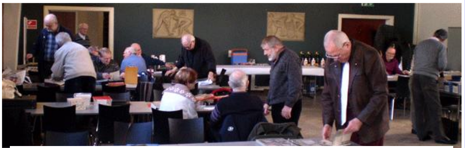
Nordmænd, Svensker og danskere fra nær og fjern i aktivitet!